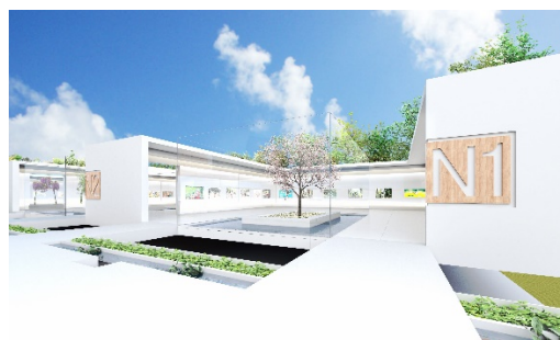
展示エリア 壁面に美術展、舞台芸術など動画、VR、画像を展示

バーチャル日本博 URL https://japanculturalexpo.jp/