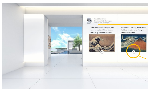
展示エリアの様子（例） 特別展「富嶽三十六景への挑戦 北斎と広重」江戸東京博物館

オンライン上で、実際に行われる日本博事業とのつながりを持たせつつ、1万年前の縄文時代の文化財から、仏像などの彫刻、浮世絵、工芸、きもの、ファッション、現代アート、マンガ・アニメなどの展覧会、歌舞伎、能楽、文楽などの伝統芸能、現代舞台芸術、芸術祭、アイヌ文化を活用した各種体験事業などのコンテンツを日本語と英語で掲載し、国内外からアクセス可能な体験型のバーチャル空間を構築していきます。