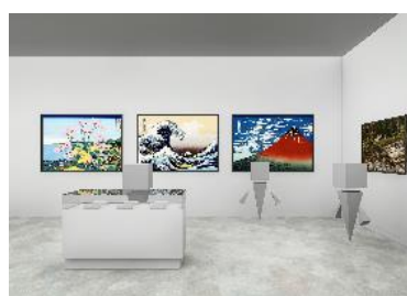
美術展覧会コンテンツ鑑賞イメージ