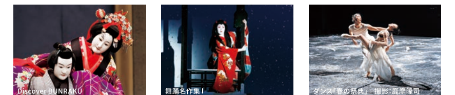
Discover! NINRUKU 舞馬を伴奏! ダンスの心算!

お子様・初心者にも分か りやすいワークショップ 形式で、演芸の世界を楽 しく体験できます。