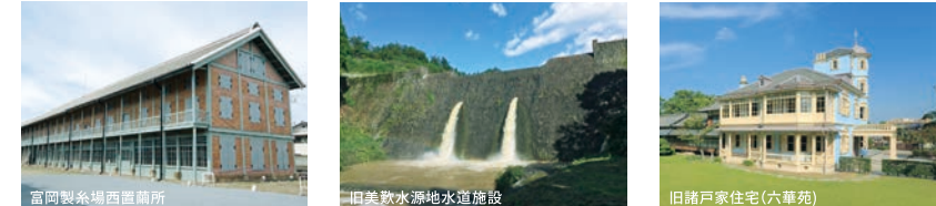
富田製糸場西蔵庫 田島製水湧水発電施設 旧鎌倉住宅(六車苑)

水道や電気、鉄道など、幕末から昭和までの日本の近代期に、先人たちが海外か らの技術等を取り入れながらつくりあげてきた、全国各地の近代化遺産を公開し、 魅力を発信します。