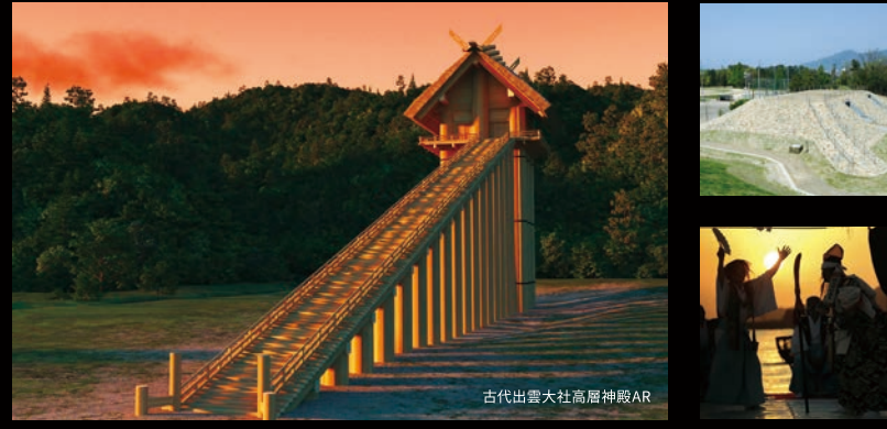
古代出雲大社高麗神楽AR

出雲の自然、歴史、文化等を、デジタルコンテンツや現地周遊を通して体験する。古代出雲大社高麗神楽の再現など、現地で楽しめるVR/ARを提供するほか、出雲神楽公演を開催する。