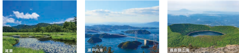
尾瀬 瀬戸内海 高野山・江

全国各地にある34の国立公園の魅力を国内外に発信。ツーリズムEXPO ジャパン 2022(一般日:9月24日(土)～25日(日))では、最先端の8KVR映像によるバーチャル 国立公園が体験できます。