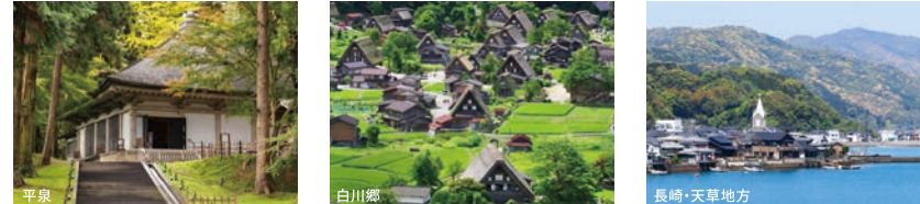
平泉 白川郷 長崎・天草地方

世界文化遺産を持つ市町村が連携し、催事を年間を通じてリレー形式で展 開するプロジェクト。四季の自然美や日本の歴史を11言語のHPや映像、 SNSなどにより世界に発信します。